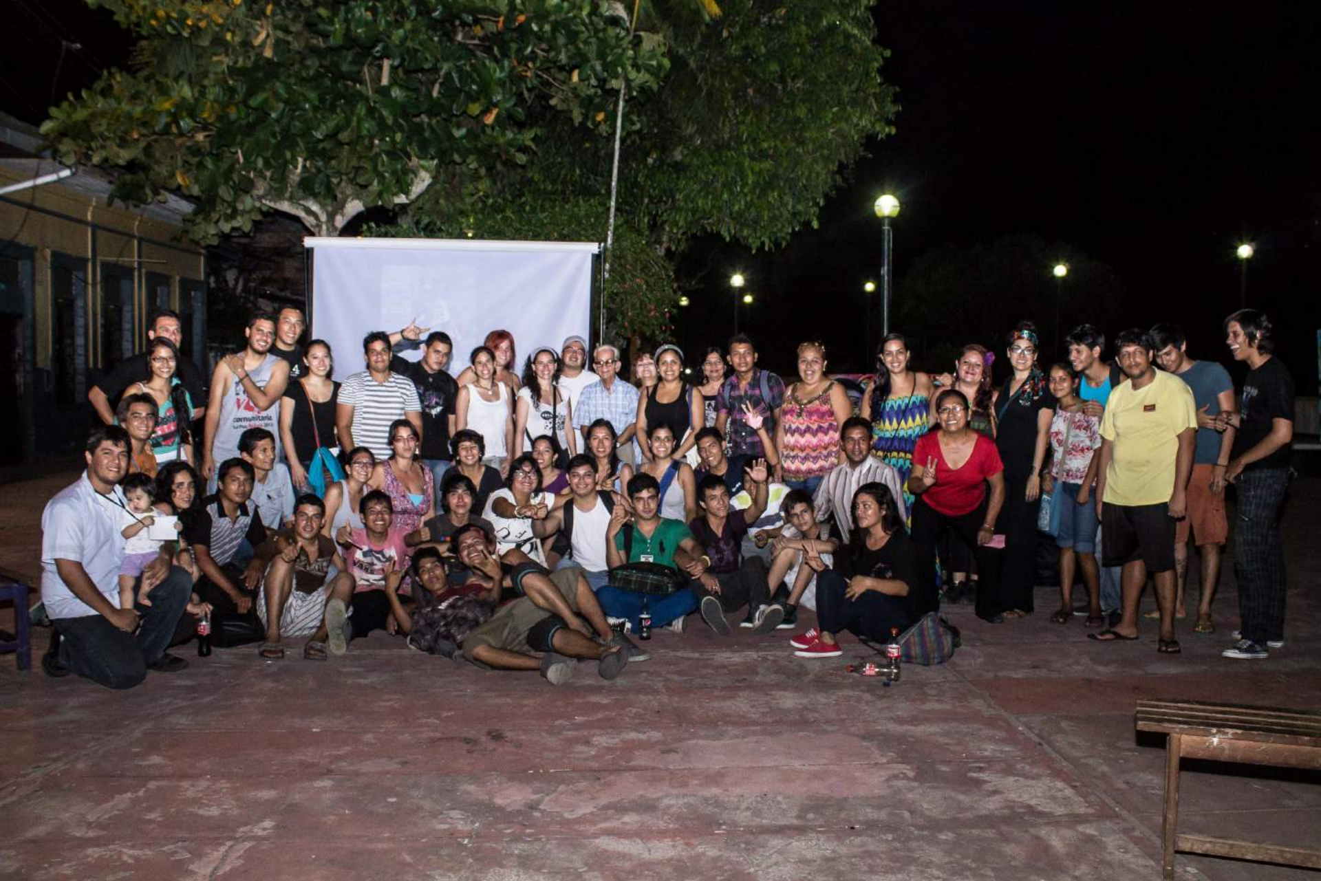
Arteria Cultural Iquitos, Loreto